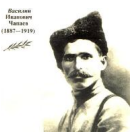
Василий Иванович Чапаев

Другие псевдонимы Троцкого- Перо, Антид Ото, Л.Седов, Старик.