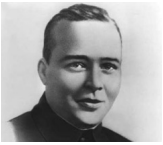
Аркадий Петрович Гайдар

наизусть стихи практически любого поэта. Откуда происходит псевдоним, мне неизвестно. Также публиковался в одесских газетах и юмористических журналах под псевдонимами "Некто Вася", "Нина Воскресенская", "Рабкор Горцев".